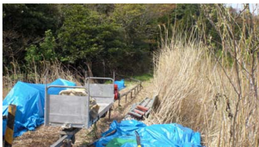
モノレールで資材を運搬します。

※ 詳細については別途通知をお送りしていますが、ご不明な点はお問い合わせください。