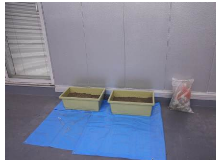
作業状況の写真：「貯蔵」という方法でどんぐりを保存しています。