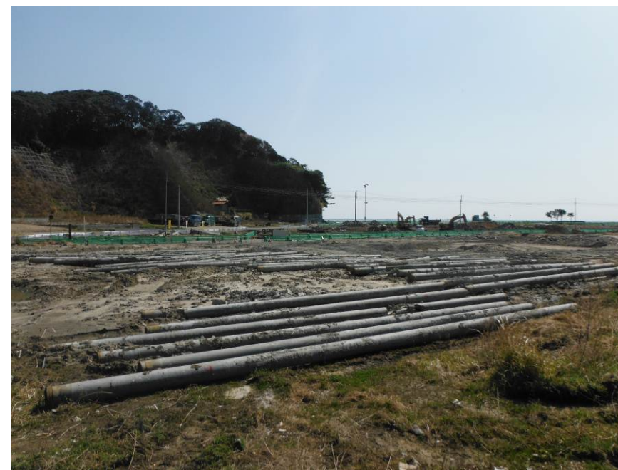
建物の基礎杭を撤去しました。

安全第一、早期完成に努めてまいりますので、引き続きご理解ご協力のほどお願い申し上げます。