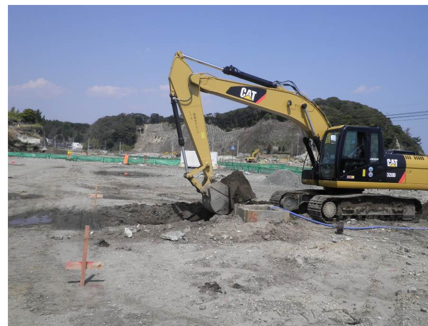
井戸の撤去のための掘削を行っています。