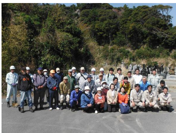
出発前の集合写真

薄井神社～薄磯避難路～古峯農商神社・八坂神社周辺にて310本（28種類）の苗木を採集することができました。ご協力ありがとうございました。採集して頂いた苗木は大切に育成して、豊間・薄磯地区の防災緑地や公園に移植する予定です。（生育状況等を定期的に報告させて頂きます。）