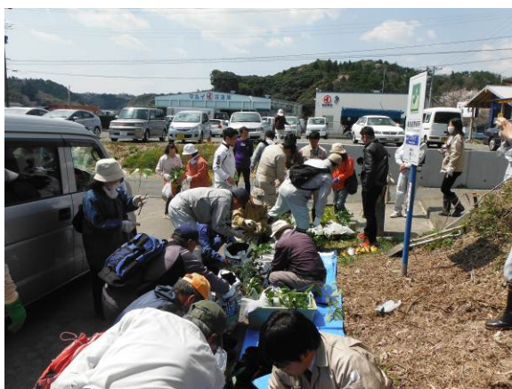
八坂神社前でポットへの植付