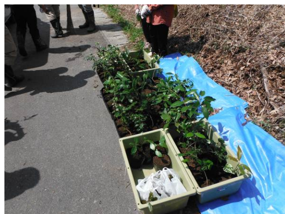
植付して頂いた苗木（一部）