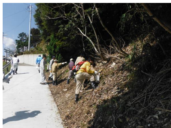
薄井神社の参道にて苗木採集