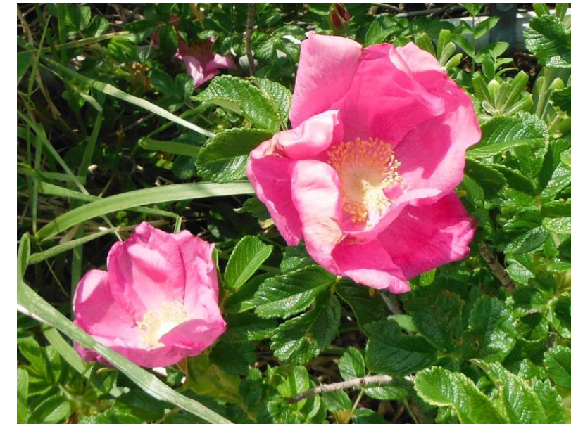
旧豊間中学校に咲くハマナス