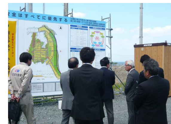
薄磯PRルーム前（旧豊間中学校南側）にて説明を行いました。