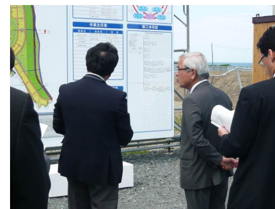
市都市建設部 阿部次長（左）が、青柳長官（右）に事業概要の説明を行いました。

5月2日（金）午後に、青柳文化庁長官が薄磯地区を来訪され、いわき市、UR都市機構にて現地の説明を行いました。