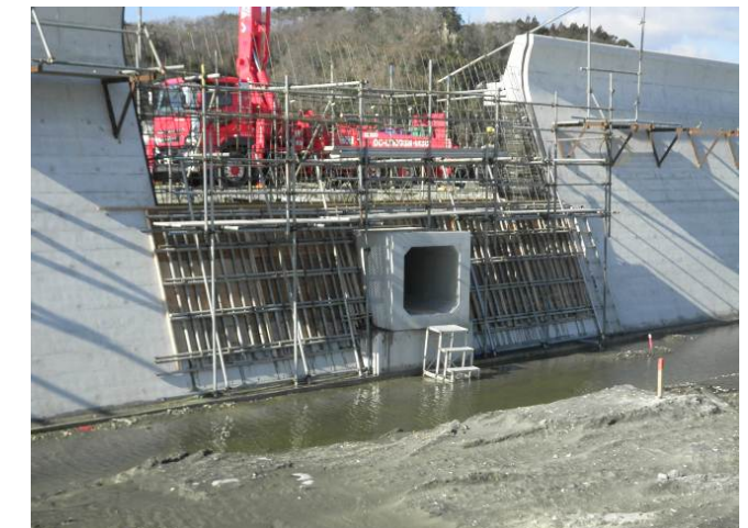
流末水路の工事(海岸堤防接続部)を行っています。