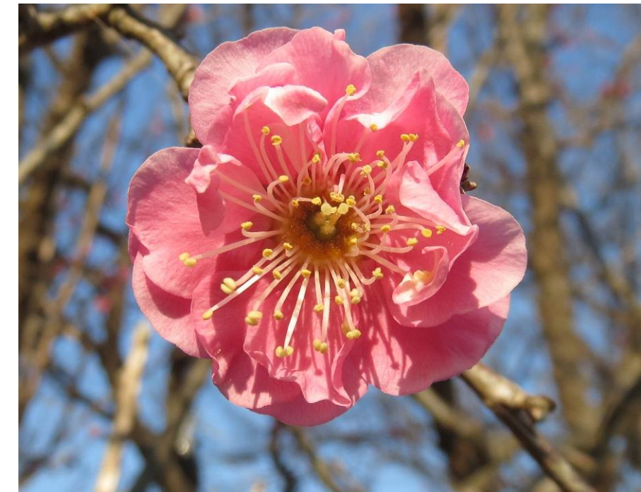
地区内に咲く梅の花