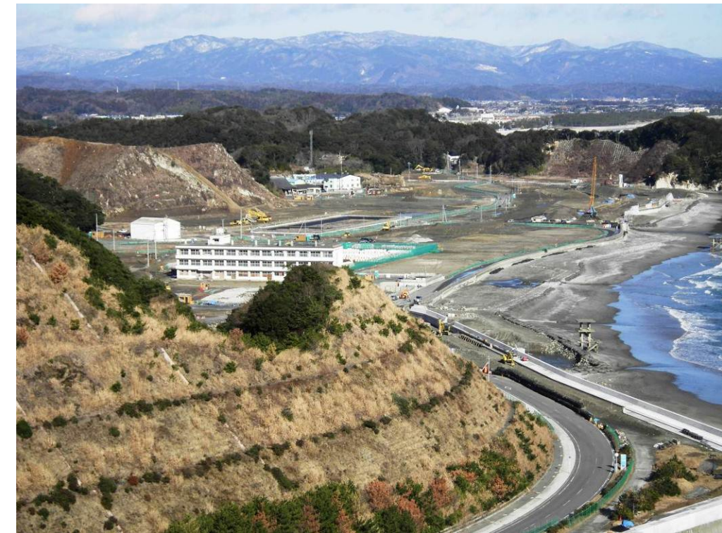
塩屋崎灯台からの工事状況です。高台や平場の造成工事、海岸堤防工事等が進んでいます。旧中学校体育館の解体が完了しました。

また、仮換地指定・使用収益停止させて頂いた皆様の土地につきましては、工事のための資機材置場や仮設駐車場として活用させて頂く場合がございますので、予めご了承ください。