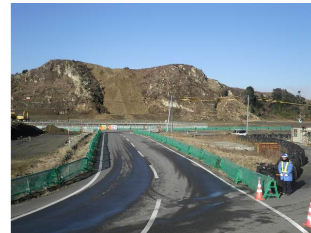
高台の造成状況です。