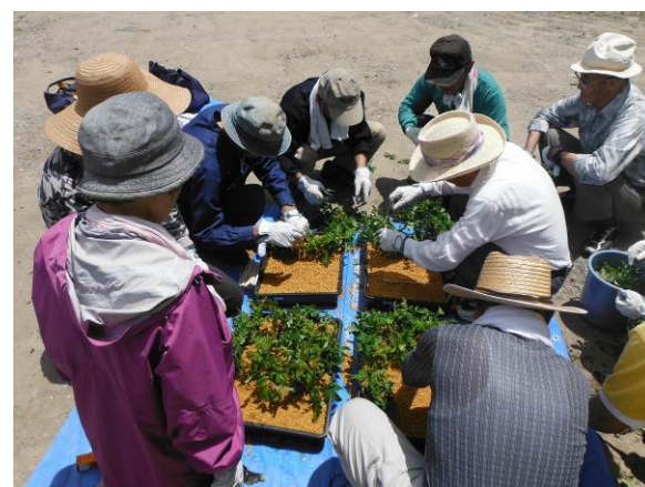
挿し木を行っています