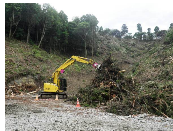
高台の伐採・集積を行っています

安全第一、早期完成に努めてまいりますので、引き続きご理解ご協力のほどお願い申し上げます。