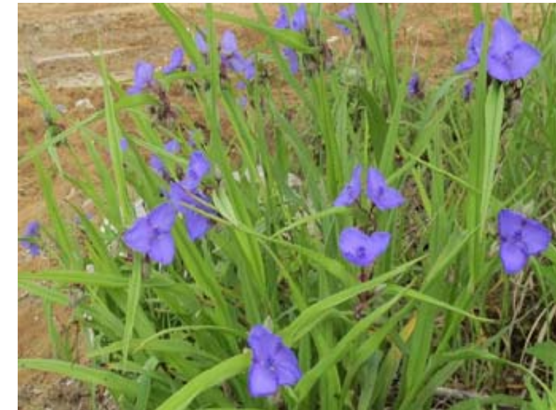
地区内に咲く紫つゆ草