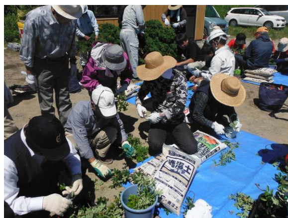
地区内で採集した枝を挿し木用にカットしました