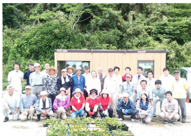
挿し木完了後の集合写真