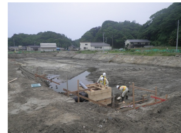
仮調整池を作っています