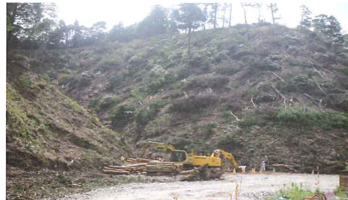
伐採した樹木を集積しているところ