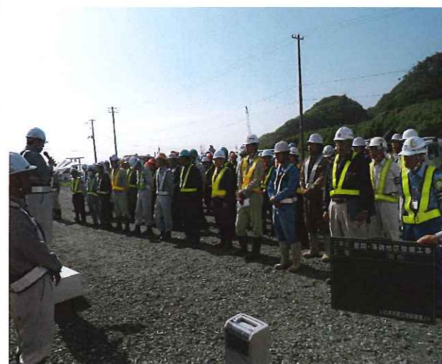
安全週間初日の安全大会