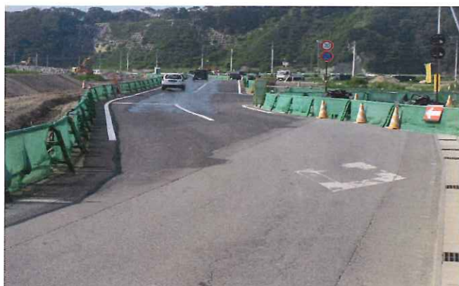
新たに作られて迂回路

先月25日に今まで使っていたバス通りが一部仮設迂回道路に付け変わり、海岸線の道路が一部通行止めになりました。いよいよ本格的な工事が始まります。山を掘削するための伐採工事や切った木や土を運び出す仮設道路工事も順調に進んでいます。このまま順調に工事が進むと、秋ごろに山の土を運び出す準備が整います。ダンプが1日何十台も動くこととなりますが、安全を第一に工事をします。