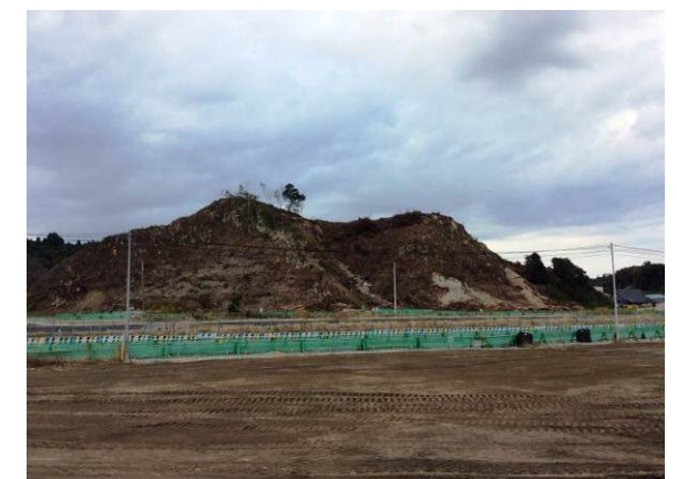
高台部の伐採を行っています