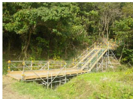
写真② 小名浜四倉線側出入口