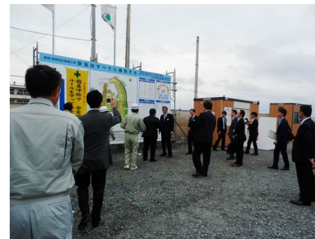
薄磯 PR ルーム前での説明状況

10月23日（木）午後、竹下復興大臣が薄磯地区を来訪され、清水いわき市長が現地で説明を行いました。