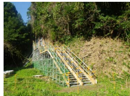
写真① 豊間小学校側出入口