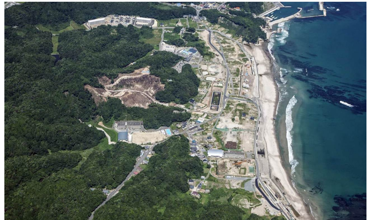
地区の近景（H26.8末撮影 約半年間隔で撮影予定です）

工事は安全第一に努めてまいりますので、引き続きご理解ご協力のほどお願い申し上げます。