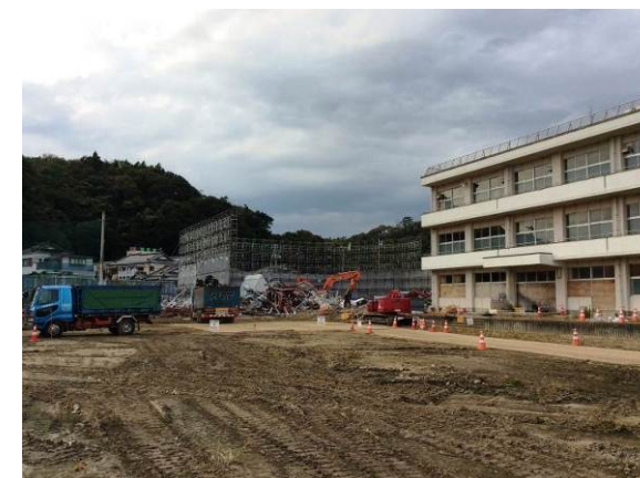
旧中学校体育館の解体を行っています