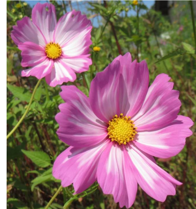
地区内に咲くコスモス