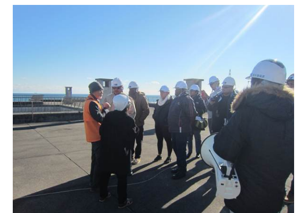
語り部さんによる被災状況説明を行いました