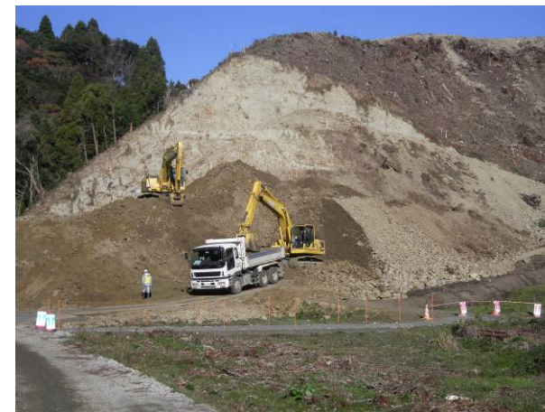
豊間小学校裏の土工事を行っています

工事は安全第一に努めてまいりますので、引き続きご理解ご協力のほどお願い申し上げます。