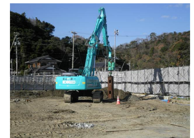
旧豊間中学校体育館の上物解体がほぼ完了し、基礎杭の撤去を行っています