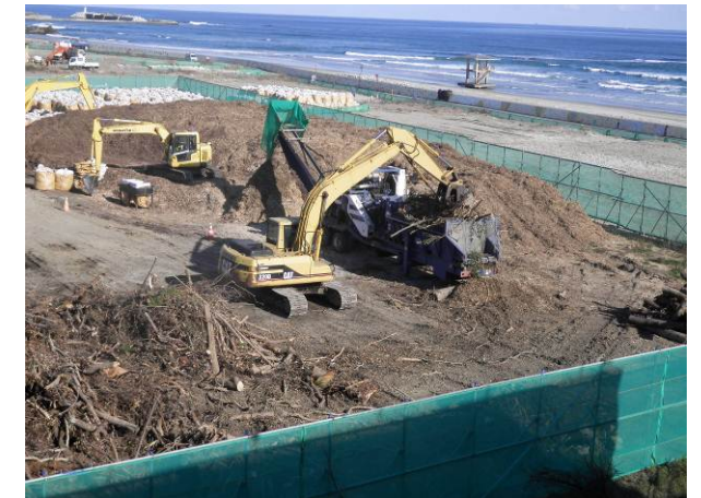
高台部で伐採した枝葉を集積してチップ化しています