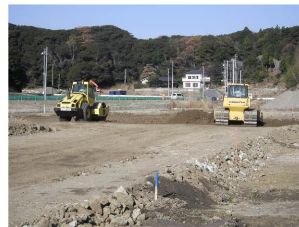
平場部で試験盛土(品質管理試験)を行っています