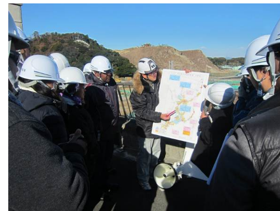
震災復興事業の概要説明を行いました

外務省主催「太平洋島嶼国政府関係者グループ招へい事業」により、平成26年12月6日（土）に、トンガやパプアニューギニア等から太平洋島嶼国の若手行政官13名がいわき市を訪問され、旧豊間中学校校舎屋上にて薄磯地区を視察して頂きました。