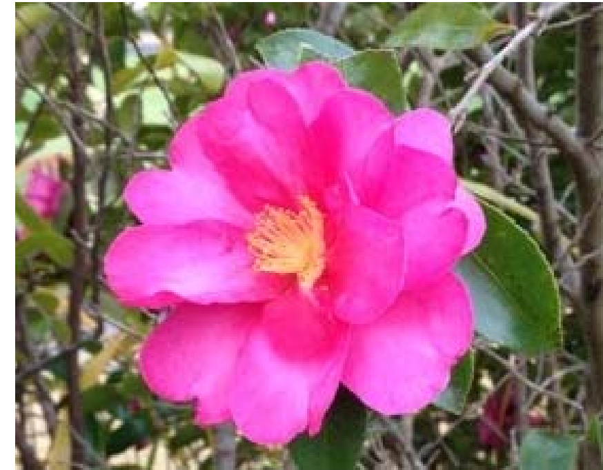
地区内に咲く山茶花（さざんか）