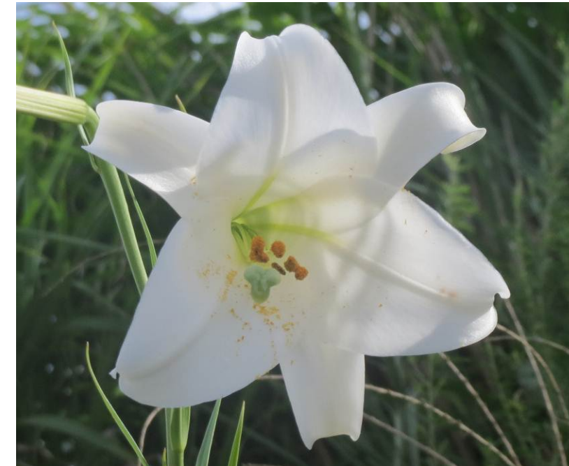
地区内に咲くシンテッポウユリ