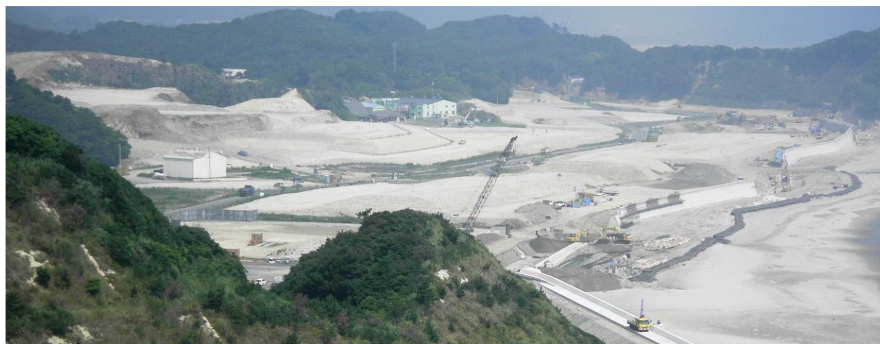
塩屋崎灯台からの全景

https://goo.gl/7RHRAO ※【注意】赤字は数字、黒字は7ル7アット大文字、他は小文字です。