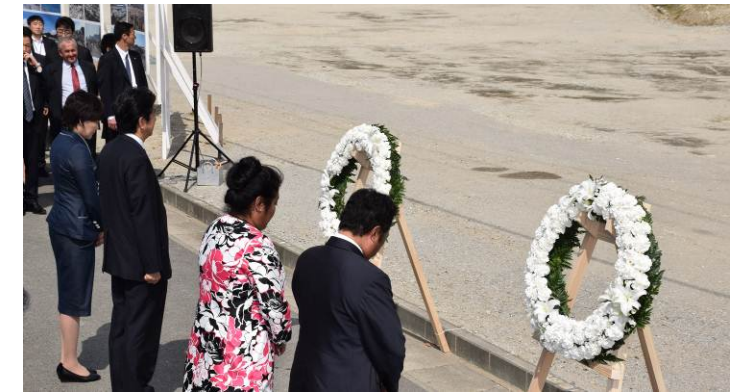
各国首脳が献花・黙祷を行いました