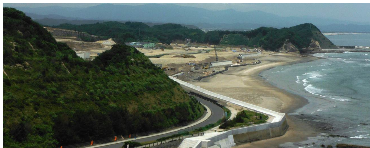
塩屋崎灯台からの全景

注1：この図面は、 宅地引渡し予定時期（住宅建築可能時期） を、概ねのエリアで示したものであり、一部、記載の時期より早く引渡しが可能な宅地も含まれます。 注2：工事等の進捗に伴い、引渡し予定時期に変更が生じた場合には、改めて、お知らせします。 注3：宅地引渡し時期等の詳細につきましては、今後、事業の進捗に合わせ、個別面談等により説明させていただきます。