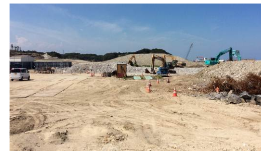
旧豊間中学校校舎の解体状況 (基礎部以外はほぼ完了しました)