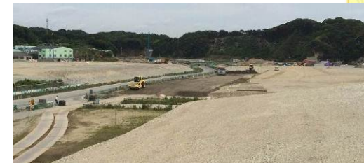
平場・防災緑地の造成状況