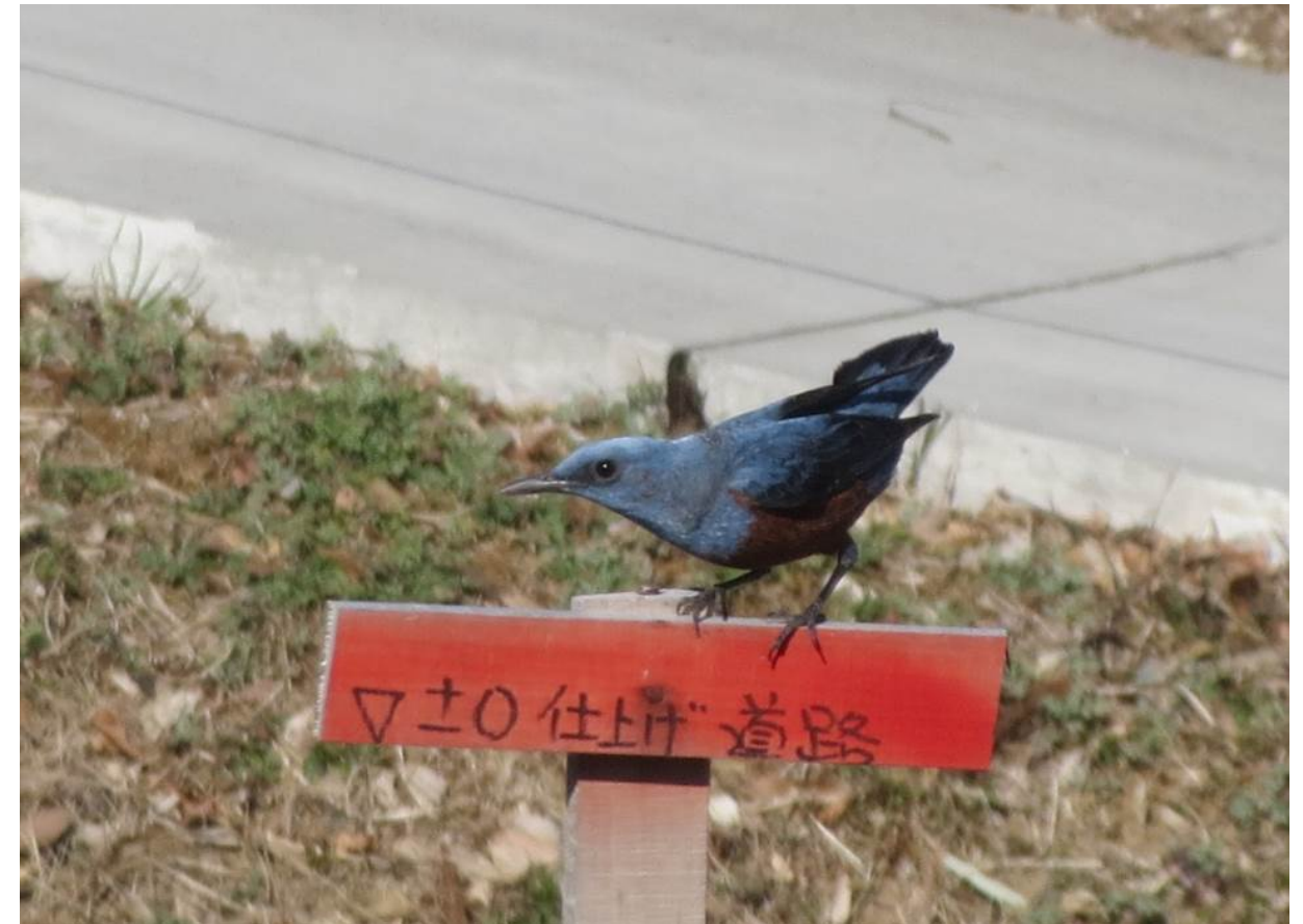
地区内工事現場に佇むイソヒヨドリ